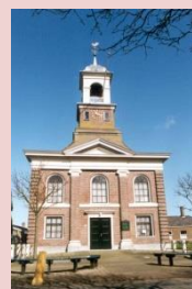
Waddenkerk De Cocksdorp