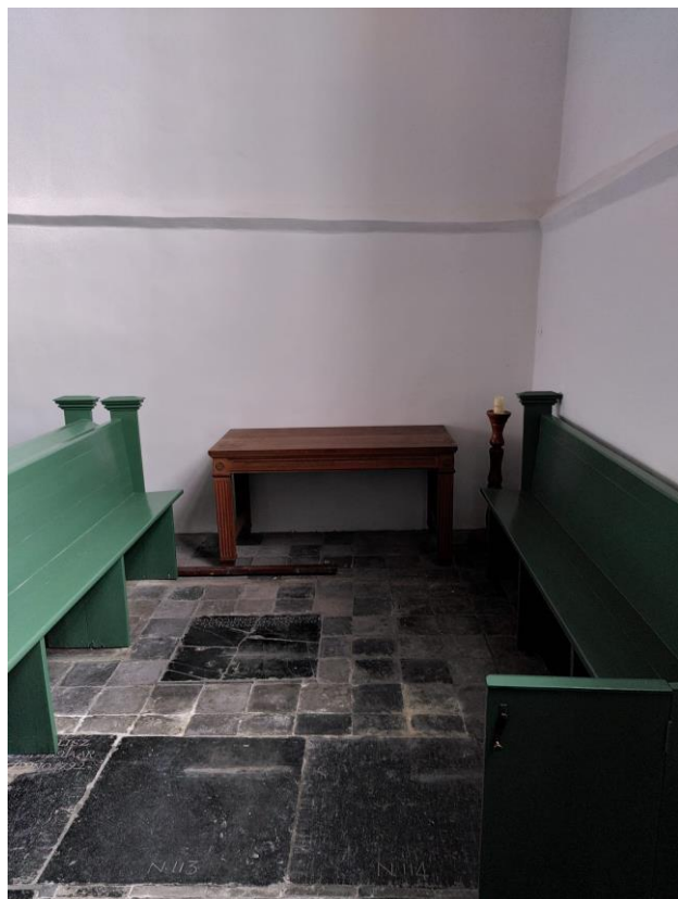
De stiltehoek in wording.

Vorig jaar presenteerde de interieurcommissie plannen voor een herinrichting van de Maartenskerk. Een stiltehoek in de rechterzijbeuk en een expositiehoek in de linker zoudens meer rust en overzicht in de kerk moeten brengen. Dit plan werd goedgekeurd door de kerkenraad en op de gemeente-avond. Inmiddels zijn de werkzaamheden begonnen. Met Pasen zijn de eerste vruchten ervan te zien. De stiltehoek heeft vorm gekregen en het aanzicht van het liturgisch centrum ziet er rustiger uit. De expositieruimte vraagt nog wat meer werk, maar ook dat zal in de komende tijd worden ingericht.