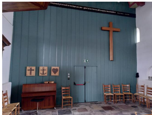
Een opgeruimd liturgisch centrum

Op bijgaande foto's zijn de eerste resultaten te zien. De komende tijd zullen we het beproeven. Laat ons weten wat u ervan vindt.