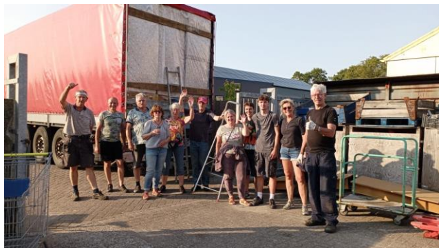
Bijna alle hulpgoederen hebben al een bestemming gekregen.