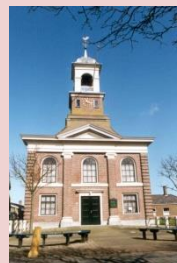
Waddenkerk De Cocksdorp