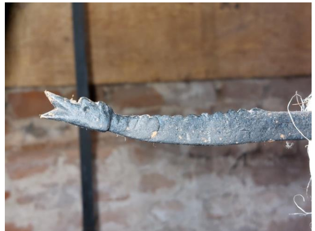
Detail van ons oude uurwerk