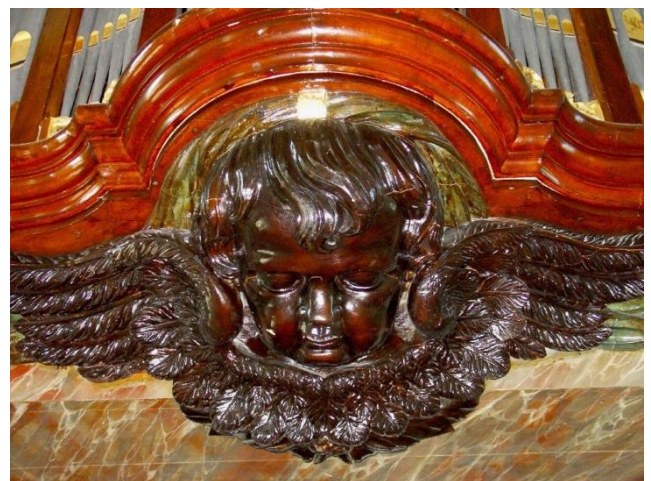
Ornament orgel

meedoen belangrijker is dan het winnen. In de gemeente van Christus vieren we die relationele levenshouding en houden we het verlangen naar een rechtvaardige wereld hoog. Gelovend dat die in relatie tot God en elkaar, in die relatiedriehoek, een kans van slagen heeft. Aangeraakt door de Eeuwige zetten we ons beste beentje vóór. In ons leven, in de kerk. Geen camera die het registreert (nou ja, de diensten, dan 😊), geen plak mee te behalen, maar wel een diepe vreugde aan te beleven. Met hartelijke groet, ds. Wikke Huizing