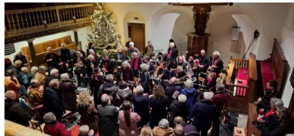
Kerstconcert fanfarekorps D.E.K.