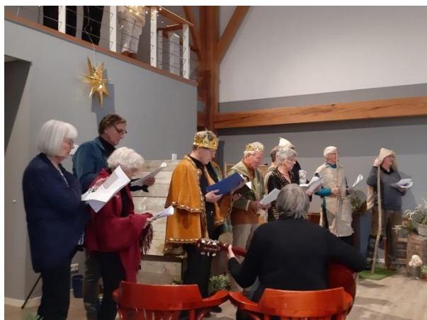
19 december 2024

speelden zonder verlegenheid hun kerstspel met volle overtuiging, aangekleed als engelen, herders en andere karakters uit het kerstevangelie. Alsof de tijd had stilgestaan kwam de groep naar voren, speelde, zong en sprak in het verhaal dat nooit oud wordt. Een voordeel bij een kerstspel door en voor volwassenen is dat er ook soms een wat ander lied tussengevoegd kan worden, al staat het script min of meer vast. Er werd erg veel gezongen, wat zal daar veel voorbereiding in gezeten hebben! Het mooiste vond ik dat door alle rollen heen iedereen vooral zichzelf was, waardoor ook het Texels dialect niet gemist werd.