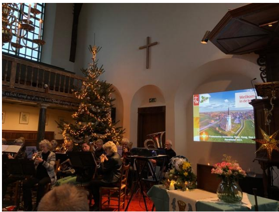
Projectie op de wanden van de gerestaureerde kerk van Den Hoorn.