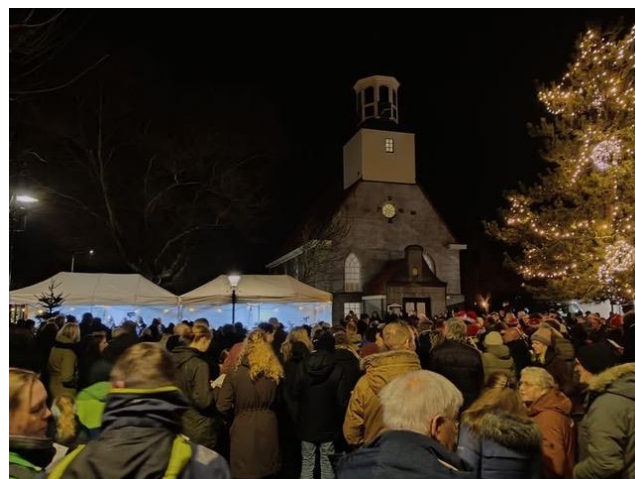
De dorpszang in De Koog