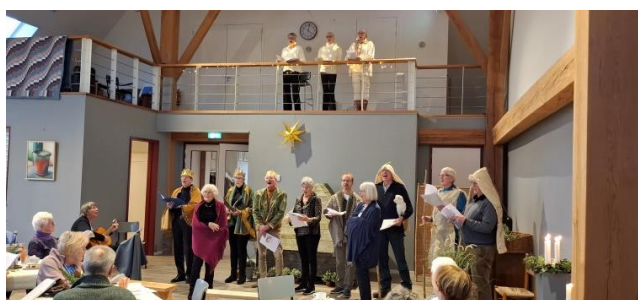
19 december 2024

Na afloop werd er nog geruime tijd nagepraat en waardering uitgesproken vanuit het publiek naar de spelers en organisatoren. Warme chocola en glühwein werden rondgedeeld en hiermee werd de geslaagde middag afgesloten. Een nieuwe traditie? Van mij mag het. Alfred Valstar